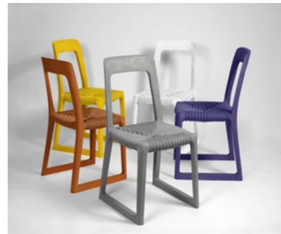
Déclinaison de la chaise Riviera du designer Sénéquier ©Sénéquier

Ce tabouret en bois brut, baptisé Hagii, présente la particularité d'être montable et démontable en seulement une minute. Conçu pour que son assemblage ne nécessite ni colle, ni vis, il est intégralement fabriqué dans l'Orne, réduisant ainsi les kilomètres parcourus tout au long de son processus de fabrication. Le tabouret est décliné en trois essences de bois : le chêne, représentant 27 % des forêts françaises et largement présent dans les forêts normandes ; le frêne, aux besoins en eau limités ; et le châtaignier, qui atteint sa maturité en seulement 50 ans, trois fois plus rapidement que le chêne. Inspiré du mouvement Kiwari Jutsu, l'art de la proportion, ce mobilier répartit les forces sur toute la structure comme une charpente, lui conférant ainsi stabilité et résistance.