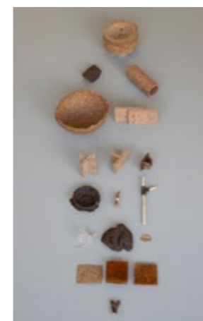
Projet Aggloméra du designer Cédric Breisacher