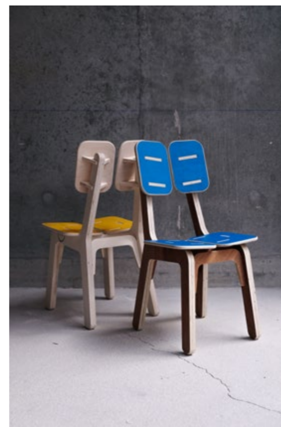
La chaise bleue de l'atelier de mobilier KOZTO

Dans le cadre de leur engagement en faveur du recyclage dans la construction bois, l'agence KOZ architectes a lancé un atelier appelé KOZTO, visant à réutiliser les déchets de leurs bâtiments pour créer du mobilier. Forts de leur expertise artisanale, les architectes emploient des technologies numériques pour découper les pièces de bois et les assembler sans recourir à des clous, des vis ou de la colle. La teinte bleue de cette chaise provient également d'une autre source de récupération : des caisses de transport d'œuvres d'art endommagées, qu'ils intègrent à leur design. L'agence n'hésite pas à organiser des ateliers scolaires et à impliquer les riverains dans leur démarche de réutilisation des matériaux.