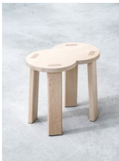
Tabouret double de Formel studio