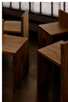
Chaise en collaboration de Lionel Jadot et Philippe Myniana