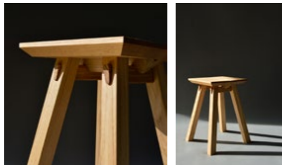
Tabouret Hagii du Studio de design global JNOB

En récupérant les chutes de bois provenant de leurs projets de construction, l'atelier Husta cherche à revaloriser la matière et à réduire l'empreinte carbone de leur mobilier. L'atelier travaille en collaboration avec des entreprises locales de charpente pour ré-usiner les chutes de panneaux de bois lamellé-croisé utilisés, constitués de planches d'épicéa, issus des découpes de portes ou fenêtres dans les panneaux structurels. Le design du mobilier crée un contraste marqué entre le bois, généralement considéré comme léger, et l'empilement de matière qui donne une sensation de masse.