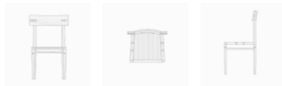
Chaise tressée de l'atelier d'architecture, de mobilier et de recherche Mattered-Matang ©Mattered-Matang

L'agence d'architecture Mattered-Matang, aussi connue pour ses magnifiques projets en bois et récompensée par les Ajap cette année, a réalisé cette chaise alliant harmonieusement bois et cordage, disponible en trois essences différentes : le chêne, le noyer et l'érable. L'assise est le résultat d'un tressage de corde danoise en papier d'une solidité remarquable. La finesse de la corde contribue à l'esthétique globale de la chaise, lui conférant un design élégant et subtil. Elle permet de faire dialoguer les deux matériaux, révélant ainsi comment l'un est transformé par l'autre. Les dimensions de la chaise sont ajustables sur mesure, démontrant ainsi un savoir-faire artisanal.