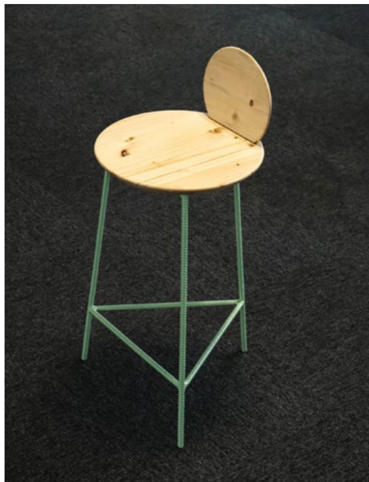
Tabouret du Collectif Tournesol