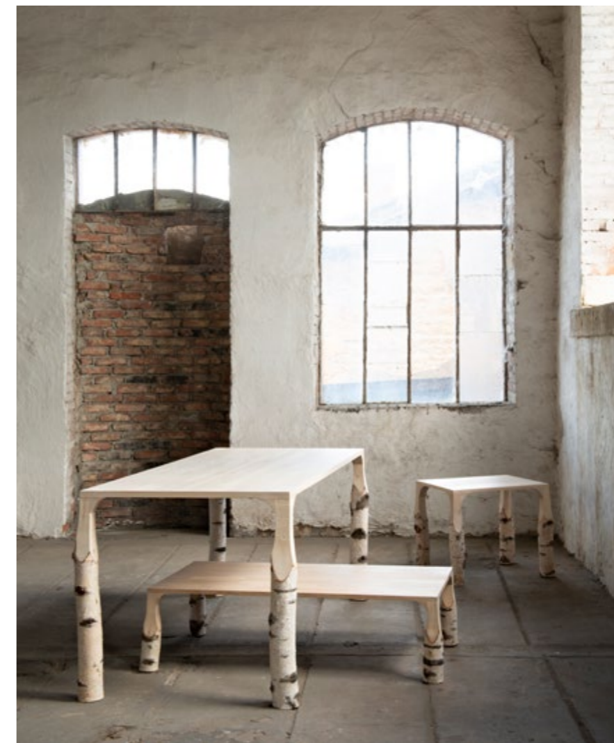
Table bouleau du designer Jean Damien Badoux

Les créations empreintes de poésie du designer Jean Damien Badoux sont principalement des pièces uniques qu'il réalise à la main. Son processus créatif puise son inspiration dans diverses sources telles que la nature ou le mouvement, ce qui confère à ses réalisations une qualité organique et sculpturale. Travaillant avec différentes essences de bois telles que le chêne ou le bouleau, il les façonne pour obtenir à la fois un aspect travaillé ou totalement brut. Il a le désir de montrer le matériau sous sa forme la plus naturelle, en conservant l'écorce du bois, comme si ses meubles étaient directement sculptés dans l'arbre.