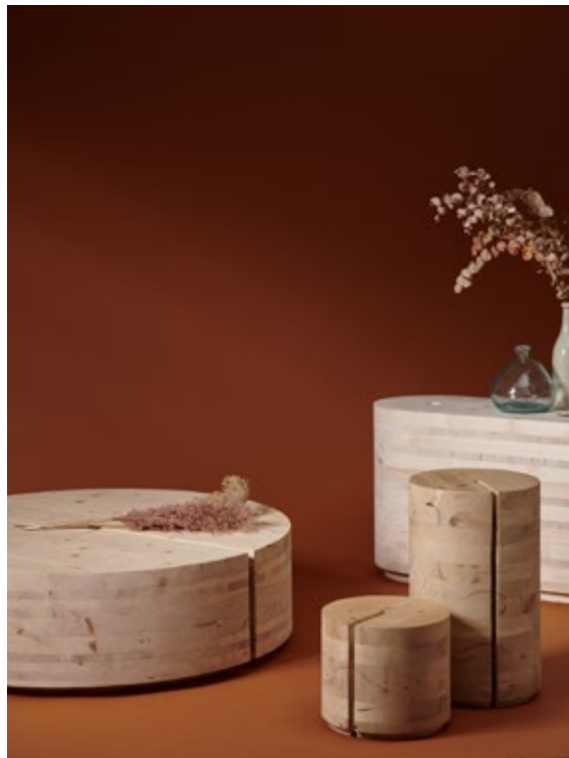
Série de mobilier de l'Atelier Husta intitulée COYO

Alors que les architectes travaillent souvent à des échelles imposantes, l'utilisation du bois dans la conception de mobilier offre une perspective plus intime. Cet univers regorge de chaises, fauteuils ou tabourets qui révèlent une diversité fascinante de créativité et d'ingéniosité. Certaines assises célèbrent l'authenticité du bois dans son état brut, tandis que d'autres incarnent une approche plus militante, de réutilisation inventive de matières, témoins de l'évolution constante du design contemporain et de son engagement envers la durabilité. Les projets d'assise présentés dans ce guide, ont su nous captiver par leur attention minutieuse aux détails, les savoir-faire méticuleux mis en œuvre, et leur capacité à fusionner fonctionnalité et esthétique de manière harmonieuse. En explorant cet univers du mobilier en bois, nous découvrons une richesse de styles, d'influences et de techniques, où chaque pièce raconte une histoire unique et invite à redéfinir notre relation au matériau bois.