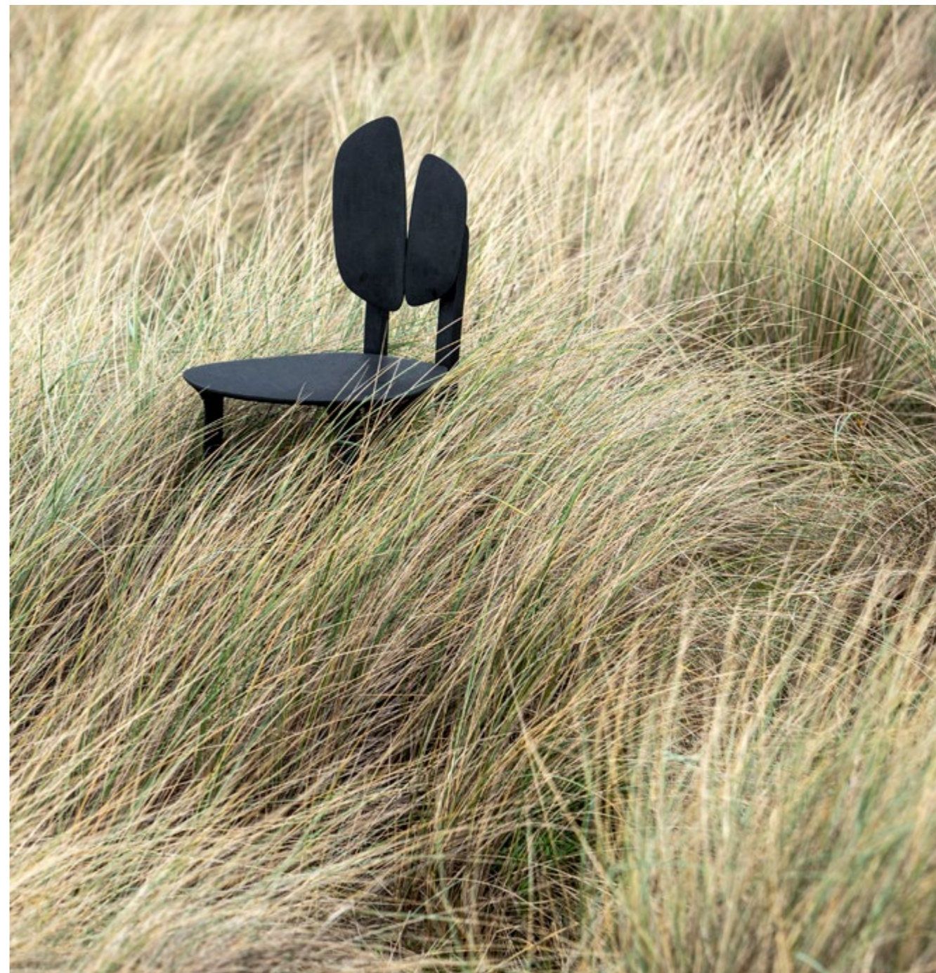
Chaise de la collection Pétiole du designer Alexandre Labruyère ©Charlotte Cornette